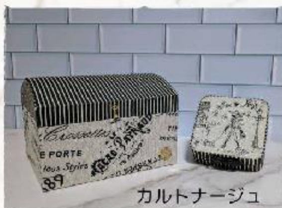
カルトナーージュ